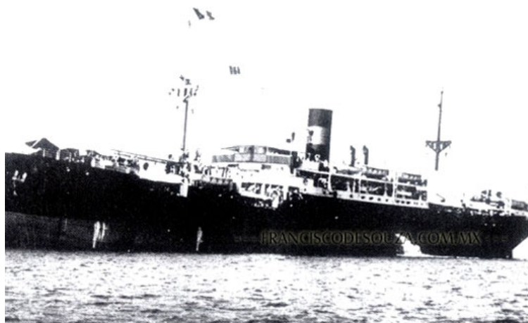
El Sinaia rumbo a tierras mexicanas, 1939.