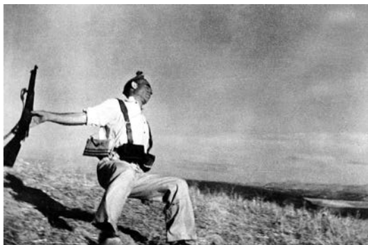
Soldado Herido, Robert Capa.

Hernández, M. L. u Tolosa, G. (2013). Evocaciones gráficas de la guerra civil española y el exilio mexicano. Clío 39. History and History teaching. ISSN 1139-6237. http://clio.rediris.es