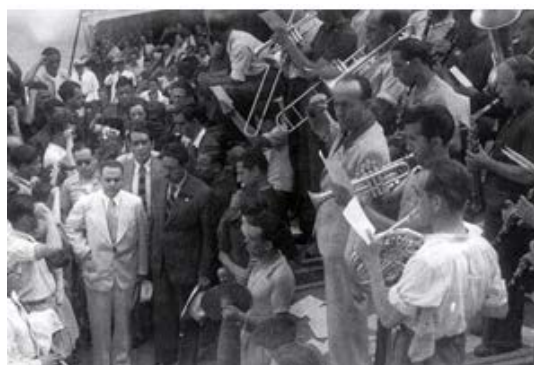
Recibimiento en el puerto de Veracruz.