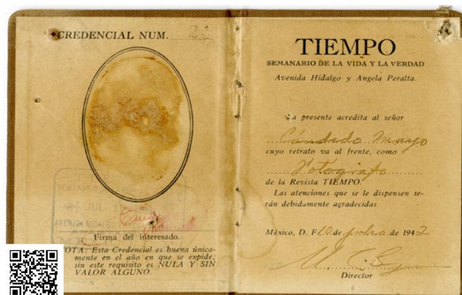
Credencial de Cándido Mayo.

Hernández, M. L. u Tolosa, G. (2013). Evocaciones gráficas de la guerra civil española y el exilio mexicano. Clío 39. History and History teaching. ISSN 1139-6237. http://clio.rediris.es