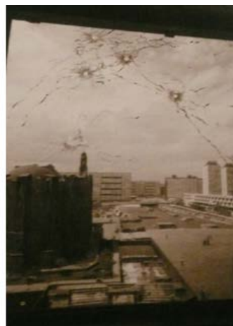
Día posterior a la matanza de Tlatelolco. México.