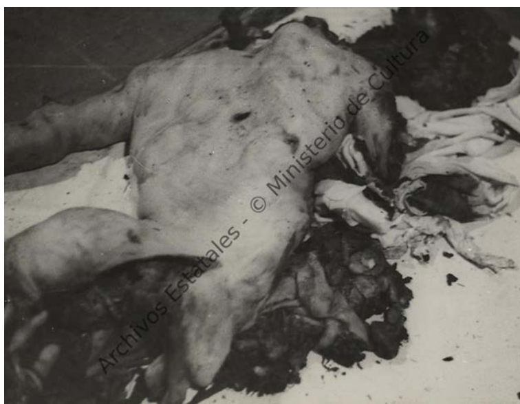
“Restos de aviador arrojado desde paracaídas por un faccioso” Heridos y muertos en la guerra leales.

La creación de un Ministerio de Propaganda por el gobierno de la República desde 1936 llegó a tener un control estricto en el ámbito estatal en zona republicana sobre los servicios de publicidad, información y propaganda. Dicho ministerio tuvo una duración breve, ya que a partir de 1937 se denominó Dirección General de Propaganda. Precisamente en este sentido, y aunque ve mermar su autonomía y el hecho de su propia posición administrativa, la propaganda tenía en este momento un peso de primer orden debido a que constituía resistencia y lucha contra los progresos de los nacionales y la ideología fascista que avanzaba a pasos agigantados, no sólo en territorio español sino europeo. La propaganda se convirtió, pues, en un arma de guerra tan eficaz o más que las propias armas utilizadas en el conflicto, finalmente la metáfora nos lleva a entender a los fotógrafos comprometidos con la causa como soldados que disparaban con las cámaras, frente a los soldados que lo hacías con pistolas en el terreno de batalla.