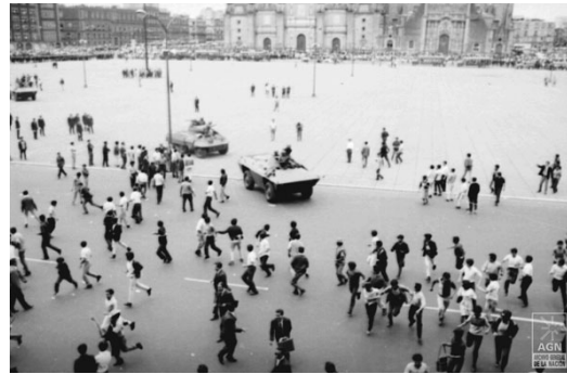
Ejército en Ciudad Universitaria y en el Zócalo.

Ahí los Mayo capturaron escenas escalofriantes, como se advierte en una famosa fotografía de una pareja que estupefacta ve los agujeros por balas de una ventana, imagen metafórica de la violencia en el México contemporáneo; al parecer, la mujer estaba embarazada y sus rostros muestran el horror que produjo tan aberrante asesinato colectivo por parte del entonces autoritario presidente de México, Gustavo Díaz Ordaz.