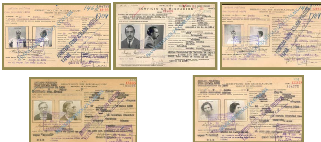
Documentación del Servicio de Migración Mexicano: Registro de extranjeros. Asilados políticos republicanos españoles, 1939. Miembros de la Familia Souza. Archivo Hermanos Mayo y Fundación Cándido Mayo.

Una vez desembarcados en Veracruz, el gobierno mexicano le encomendó a Francisco realizar las fotografías de cada uno de los migrantes para elaborar sus credenciales de identificación. Trabajó durante varios meses junto a sus colegas del colectivo, Cándido y Faustino, en la toma de instantáneas para la elaboración de dicho documento de quienes llegaron en la primera expedición en el Sinaia , así como de los que arribaron posteriormente en los barcos Ipanema y Mexique .