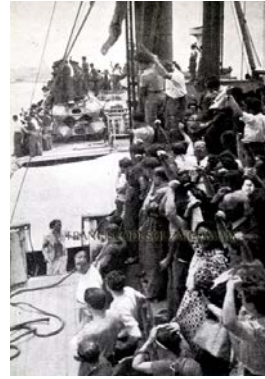
Llegada al puerto de Veracruz y desembarco del Sinaia.