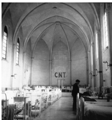
Iglesia barcelonesa convertida en orfanato, Kati Horna.