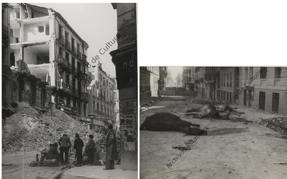
Edificios y lugares destruidos por aviación y artillería en la calle del Carmen de Madrid, y animales muertos en la calle Martín de los Herreros tras bombardeos de la Guerra Civil.

denominación, que no pone de acuerdo ni a historiadores ni a expertos sobre el tema, obedecería en principio al nombre del general republicano Vicente Rojo, responsable del plan que se llevó a cabo en la defensa de Madrid en el periodo de traslado del gobierno de la República a Valencia.