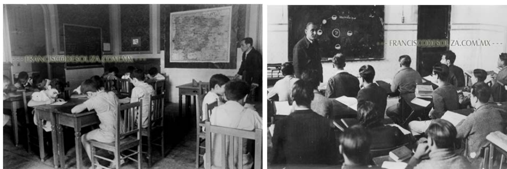
Educación y República. S/F. México, D. F.

contienda, parte de la Unión de Informadores Gráficos de Prensa (UIGP), asociación que pretendía la defensa de los reporteros gráficos en el ejercicio de su profesión. Como órgano de regulación de la actividad de periodistas y fotógrafos en la capital de España, tuvo su principal vínculo a diarios, revistas y agencias madrileñas.