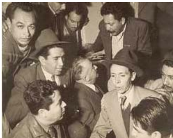
Detención de Jesús Díaz de León, el Charro, por obreros del Sindicato de Ferrocarrileros.