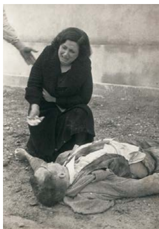
Mater dolorosa, Centelles.