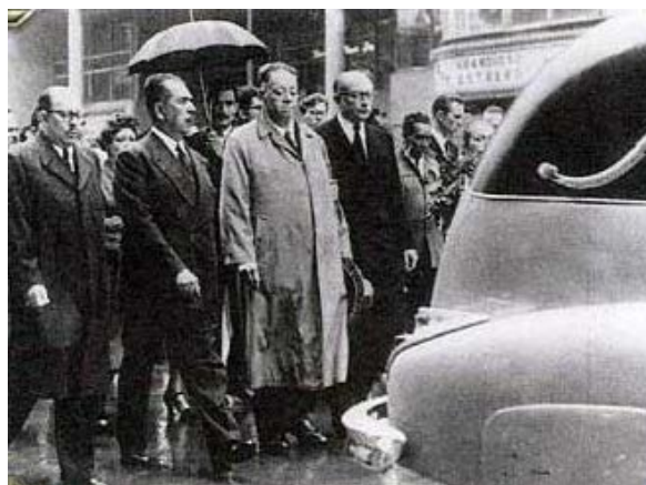
Cortejo fúnebre por la muerte de Frida Kahlo.

trabajo no es propiedad de los medios de comunicación sino de los fotógrafos. Marilyn Monroe, León Trotsky, Diego Rivera, Sara Montiel, Frida Kahlo o Robert Mitchun, entre muchos otros personajes, fueron captados por las cámaras de los Mayo, quienes recogieron en su carrera como reporteros gráficos manifestaciones, huelgas, acontecimientos políticos y aspectos sociales o de la vida diaria de México.