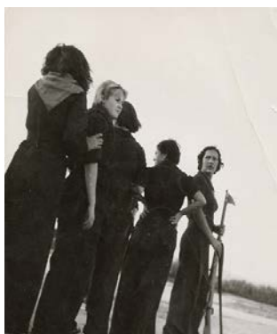
Entrenamiento de mujeres milicianas, Gerda Taro.