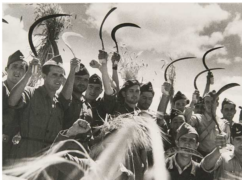
Soldados republicanos. Icono propagandístico del ejército republicano con simbología comunista: la hoz y el puño cerrado en alto.

en agosto de 1936, o esa otra desgarradora imagen de la Mater dolorosa , con la expresión de la angustia de una mujer destrozada por el dolor de la muerte de su marido, imagen de 1937 que llegó a miles de espectadores, o la que titulada Soldado alpino representa diferentes encuadres del mismo miliciano con el objeto de ser utilizada como propaganda de la Guerra Civil. Todos ellos, y otros muchos a los que por la concreción de la limitación de nuestra exposición no aludimos, constituyen claros exponentes del sentido propagandístico e impactante de unos materiales gráficos que abastecieron a la prensa en el momento más cruento de la contienda. 3 Diferente será la consideración de la guerra desde una perspectiva del fotógrafo español o del fotógrafo extranjero, pues en el caso de los primeros, la contienda adquirió una significación especial, dado el compromiso personal e ideológico, aspectos que impregnarán sus imágenes de forma única y especial, y en este sentido lo sería para fotógrafos tanto del bando sublevado como del que le fue leal a la República (Moreno y Bauluz, 2011: 11).