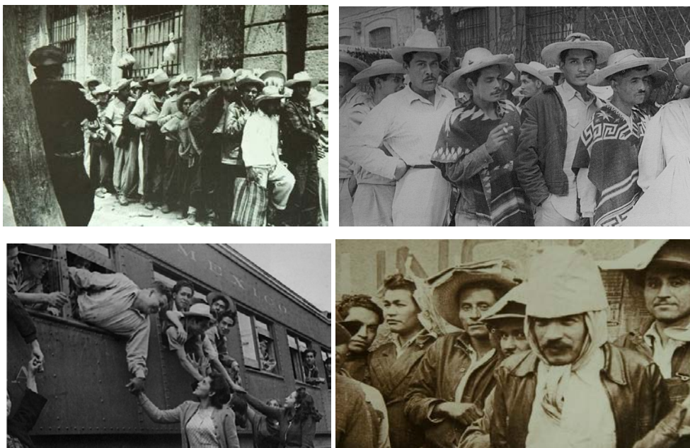
Braceros hacia los Estados Unidos. Fondo Hermanos Mayo. AGN. México.

Un aspecto que ahora viene al caso mencionar es el relativo a la experiencia que significa emigrar, ya que un éxodo como el que se vivió, producto de la victoria por parte del bando contrario a los republicanos, fue precisamente el tener que emigrar a otras latitudes para sobrevivir. En este sentido, debemos poner ahora nuestra mirada en la representación “realizada por el colectivo de emigrantes que fotografió a una migración que salía del mismo país que los había acogido a ellos” (Mraz y Vélez Storey, 2005:6). Es la historia de los braceros que durante y después de la segunda Guerra Mundial fueron contratados para trabajar en Estados Unidos de manera legal. Esta historia puede seguirse a partir de las fotografías que realizaron otros migrantes que se vieron obligados a dejar su país: los Hermanos Mayo.